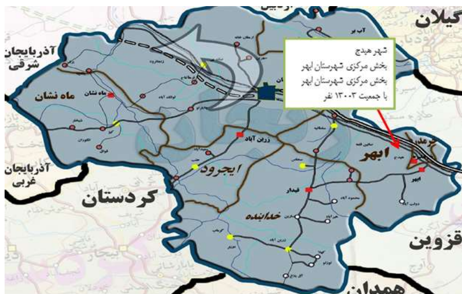
شکل ۱. محدوده جغرافیایی فعالان خوشه کفش هیدج

از نظر مکانی و جامعه هدف، این پژوهش برای کفشان شهر هیدج صورت گرفته، اما برای جمع‌آوری داده‌ها به شهرهای تهران، اصفهان، قم و زنجان مراجعه گردیده و با فعالان و صاحب‌نظران صنعت کفش آن شهر مصاحبه انجام شده است. محدوده مورد مطالعه در شکل ۱ قابل رؤیت است: