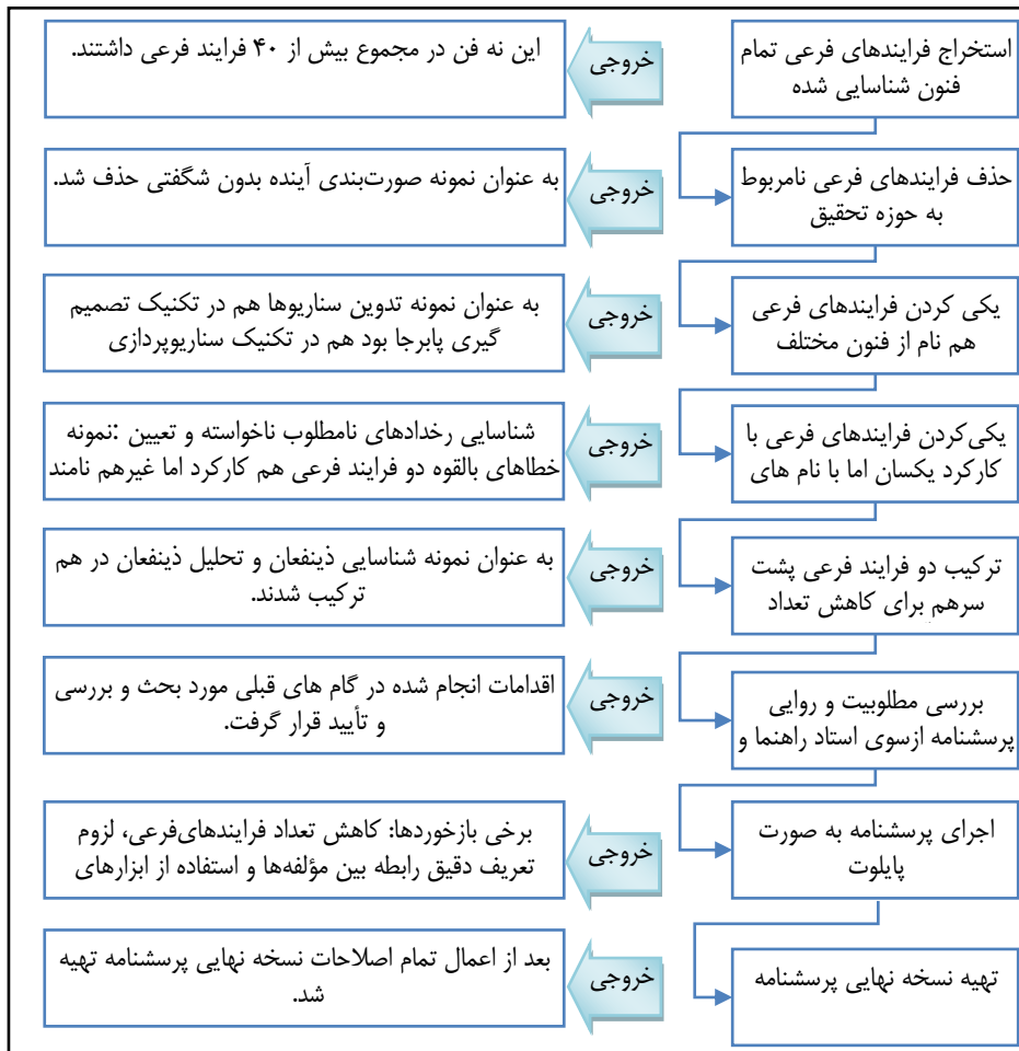
شکل ۲. فرایند طراحی و نهایی سازی پرسشنامه

صورت گرفت. سپس ترکیب دو فرایند فرعی پشت سرهم برای کاهش تعداد فرایندهای فرعی انجام شد. مطلوبیت و روایی پرسشنامه بررسی شد. پرسشنامه به صورت پایلوت تست و اصلاح شد و در انتها نسخه نهایی تدوین شد. اقدامات و خروجی‌های هر اقدام در شکل ادامه آمده است.