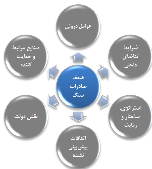
شکل ۴. مدل نظری تحقیق