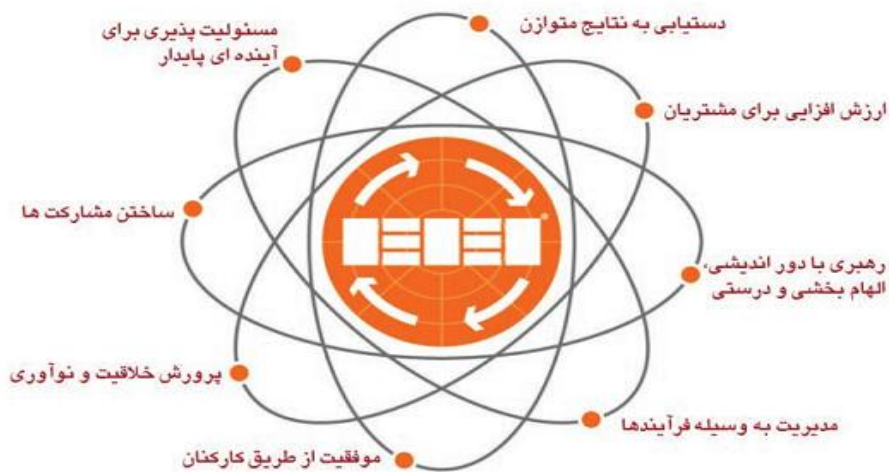
شکل ۲. روابط همه‌جانبه محورهای مدل تعالی سازمانی [۳]

درواقع می‌توان گفت یکی از محوری‌ترین نکات مورد تأکید در مدل‌های تعالی سازمانی، توسعه دایره ذی‌نفعان و تأکید بر حداکثر منافع ایشان برای حصول تعالی سازمانی بوده است [۸]. در شکل بعد این چارچوب و روابط همه‌جانبه محورهای مدل نمایش داده شده است: