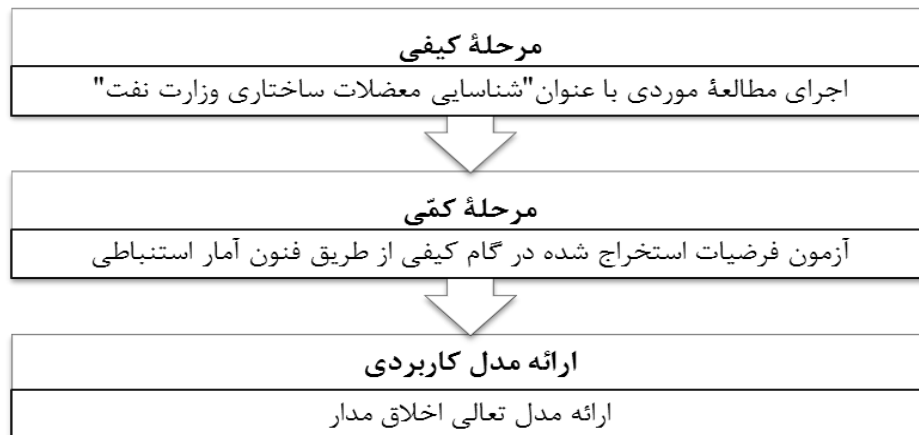
شکل ۵: فرآیند اجرای پژوهش

می‌توان پژوهش حاضر را در دسته پژوهش‌های ترکیبی لحاظ نمود). فرآیند اجرای پژوهش در شکل بعد نمایش داده شده است: