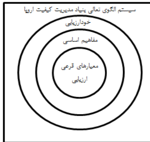
شکل ۴. سیستم مدل تعالی بنیاد مدیریت کیفیت اروپا [۱۸]

پیشینه پژوهشی مشابه. توجه به تحقیقات صورت گرفته در این حوزه مشترک (اخلاق و کیفیت)، نشان می‌دهد تحقیقات مکفی، جامع و مانع در این حوزه صورت نپذیرفته و همچنان نیازمند توجه پژوهشگران این حوزه می‌باشد [۳۷].