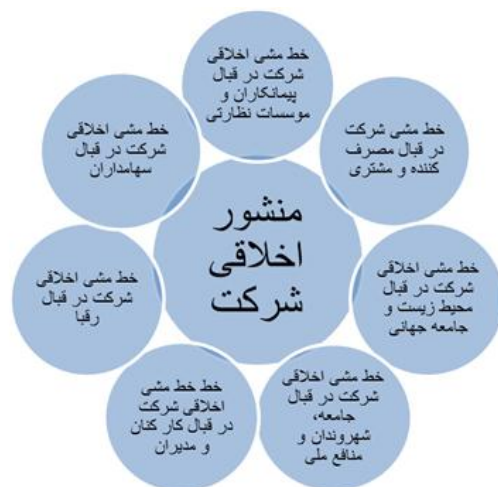
شکل شماره ۱

مدیریت کیفیت جامع. دهه‌های اخیر قرن بیستم شاهد ضرورتی مؤکد بر نگاه کسب‌وکار به یک فرهنگ جدید، یعنی نهضت یا پارادایم مدیریت شرکت، متمرکز بر مفهوم کیفیت بود [۸]. به‌طور کلی، مدل‌های تعالی و جوایز کیفیت بر مبنای این پارادایم یعنی مدیریت کیفیت جامع و به‌منظور استقرار این رویکرد در سازمان‌ها مطرح گردیده‌اند [۱۰]. باتوجه بر اجماع موجود بر پایه‌ای بودن اصول مدیریت کیفیت جامع در مدل‌های تعالی سازمانی، شناخت اصول آن برای ورود به بحث تعالی، ضروری به نظر می‌رسد [۸]. می‌توان گفت هر دو مفهوم مدیریت کیفیت جامع و تعالی سازمانی در حال حرکت به یک سمت‌وسو بوده و همگی جهت‌گیری یکسانی (کیفیت) را دنبال می‌کنند [۱۱]. مدیریت کیفیت جامع را می‌توان به‌عنوان یک سیستم مدیریتی که به‌طور مداوم در حال تکامل است، تعریف نمود. این سیستم شامل ارزش‌ها، تکنیک‌ها (متدولوژی‌ها) و ابزارهایی است که هدف از آن‌ها افزایش رضایت مشتریان داخلی و خارجی همراه با کاهش منابع مورد نیاز است [۲۹]. در مجموع و به‌طور خلاصه می‌توان گفت مدیریت کیفیت جامع، مستلزم شش مفهوم اصلی خواهد بود: