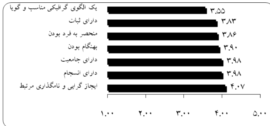
شکل ۲- نمودار مقایسه‌ای میانگین امتیازات کسب شده ویژگی‌های مطلوب مدل از نگاه خبرگان

برای انجام مقایسه مناسبی میان وضعیت ویژگی‌های مطلوب مدل با یکدیگر نمودار زیر که مقایسه میانگین ویژگی‌های مطلوب الگوی طراحی شده است ارائه شود.