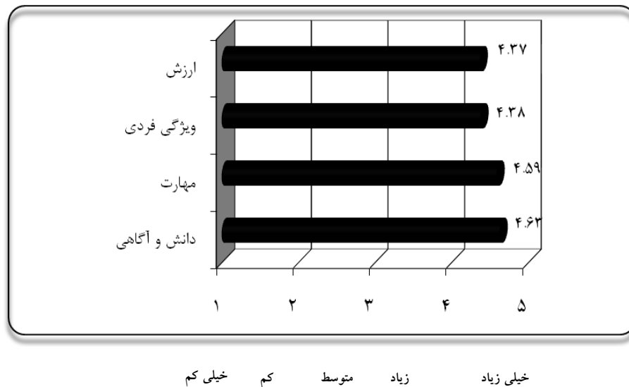
شکل ۱- نمودار مقایسه‌ای میانگین امتیازات کسب شده ابعاد الگو از نگاه خبرگان

آنان با حضور این بعد در الگوی قابلیت‌های مدیران دولتی ایران است. بعد مهارت‌ها: نزدیک به ۹۵ درصد خبرگان میزان مفید و موثر بودن بعد «مهارت‌ها» را به عنوان یک بعد محوری دیگر در حد زیاد و یا خیلی زیاد دانسته‌اند. نکته بسیار مهم در تحلیل نتایج این بعد آن است که هیچ یک از خبرگان مفید و موثر بودن این بعد را زیر متوسط ندانسته‌اند. این پاسخ‌ها نشان‌دهنده موافقت قطعی آنان با حضور این بعد در الگوی قابلیت‌های مدیران دولتی ایران است. در ادامه به منظور فراهم آوردن امکان مقایسه مفید و موثر بودن ابعاد مدل از دیدگاه خبرگان در شکل ۱ نمودار مقایسه‌ی ابعاد مختلف ارائه می‌شود: