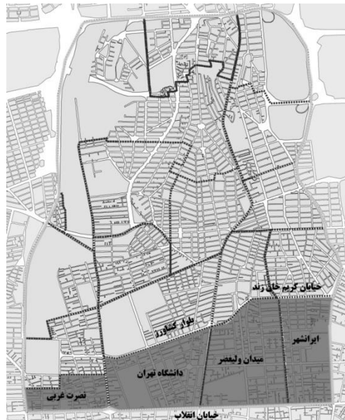
شکل ۱. نقشه موقعیت چهار محله جنوبی منطقه شش شهر تهران

دارای بیشترین میزان افت شهری در منطقه شش شهر تهران بوده است که با هم، یک محله برنامه‌ریزی همگون را تشکیل می‌دهند (شکل ۱).