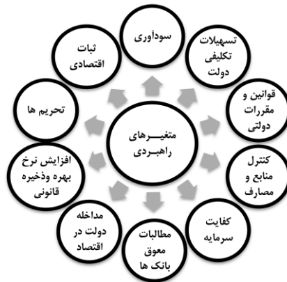
شکل ۳. متغیرهای راهبردی مؤثر بر آینده صنعت بانکداری

حاکمی از روایی بالای ماتریس و پاسخ‌های آن است. هدف نهایی از تحلیل ساختاری، شناخت ویژگی‌ها، ساختار، متغیرهای کلیدی و مهم‌ترین عناصر مؤثر بر سیستم است. در ماتریس متقاطع، جمع اعداد موجود در سطر برای هر متغیر، بیانگر جمع فعال است و میزان تأثیرگذاری آن عامل را نشان می‌دهد و جمع اعداد موجود در ستون، نیز بیانگر جمع فعال و غیرفعال است و میزان تأثیرپذیری آن عامل را نشان می‌دهد. به‌منظور شناسایی آینده‌های پیش‌روی صنعت بانک‌داری و برنامه‌ریزی بر اساس آن‌ها باید متغیرهایی که به‌صورت توأما اثرگذاری و اثرپذیری بالایی در سیستم دارند را شناسایی کرده و مورد تحلیل و ارزیابی قرار داد، این متغیرها متغیرهای راهبردی نام دارند. متغیرهای راهبردی (استراتژیک) متغیرهایی هستند که هم قابل دستکاری و کنترل باشند و هم بر پویایی و تغییر سیستم، تأثیرگذار باشند. با این توصیف متغیرهایی که تأثیر بسیار بالایی دارند، ولی قابل کنترل نیستند را نمی‌توان متغیر راهبردی محسوب کرد. مقایسه متغیرهای تأثیرگذار و تأثیرپذیر بر اساس رتبه‌بندی آن‌ها نخستین گام در یافتن متغیرهای راهبردی است. بر این اساس، چنانچه تعداد متغیرهای تکراری در تأثیرگذارترین و تأثیرپذیرترین متغیرها «بالا» باشند، سیستم دارای تعدادی متغیر راهبردی است که قابلیت کنترل و هدایت سیستم را آسان می‌کند.