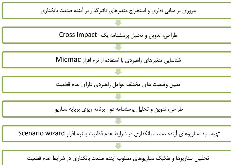
شکل ۲. فرآیند انجام پژوهش

جامعه و نمونه آماری پژوهش. جامعه آماری در این پژوهش شامل مجموعه‌ای از متخصصان و خبرگان صنعت بانکداری که از دیدی آینده‌پژوهانه و راهبردی برخوردار بودند که حجم آن در حدود ۳۰ نفر برآورد می‌شود. نمونه آماری متشکل از ۸ نفر از خبرگان حوزه یادشده است که براساس روش نمونه‌گیری از نوع «نمونه‌گیری قضاوتی و هدفمند» و در دسترس انتخاب شدند. با توجه به نوع جامعه آماری موردنظر و با توجه به نوع اطلاعات لازم برای انجام پژوهش، از نمونه‌گیری یادشده استفاده شده است. در جدول ۱، به ویژگی‌های جمعیت‌شناسی نمونه‌های پژوهش (توزیع جنسی و سنی میزان تحصیلات و شغل) پرداخته شد.