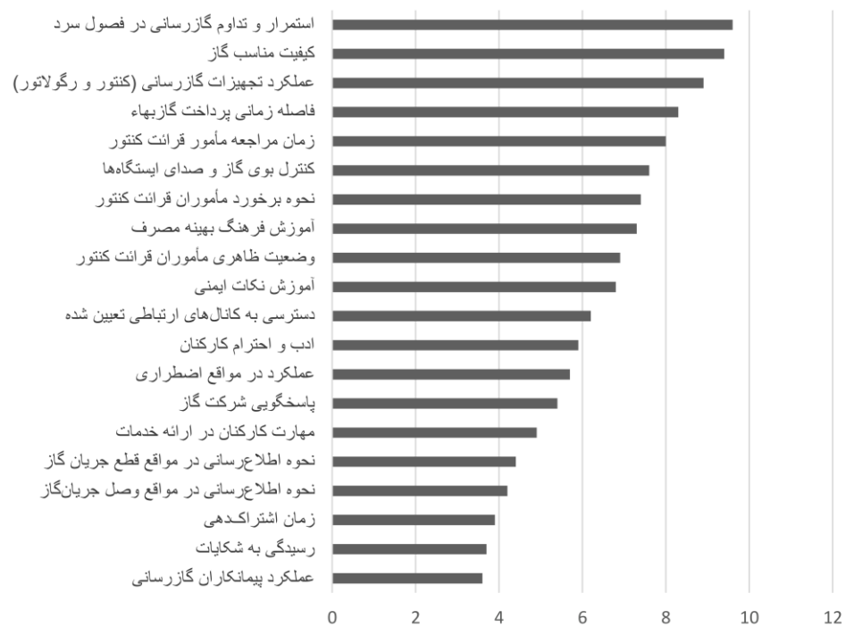
نمودار ۳. رتبه‌بندی مقوله‌های مورد بررسی بر پایه نمره رضایتمندی مشتریان

مروری بر داده‌ها و یافته‌های این پژوهش که قسمتی از آن در قالب نمودار ۳ به نمایش درآمده، مؤید همین نکته پیشنهادی است.