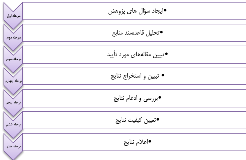
شکل ۱. مراحل فراترکیب

درمورد روایی فراترکیب، برخلاف پژوهش های کمی، هیچ آزمون استاندارد در میان پژوهش های کیفی برای روایی وجود ندارد و غالباً ماهیت پژوهش به وسیله خود پژوهشگر تعیین و تعدیل می شود و حتی ممکن است هیچ فرضیه اولیه ای وجود نداشته باشد. بنابراین ماهیت مفهوم روایی در پژوهش های کیفی به بازنمایی مشارکت کنندگان، اهداف پژوهش و مناسب بودن فرآیندها ارتباط دارد [۱۵، ۳۶]. به عبارت بهتر، برای تضمین تدریجی روایی و پایایی در طی فرایند پژوهش یک پژوهش کیفی، از سازوکاری با عنوان «ممیزی پژوهش» استفاده می شود. اما ابزاری که معمولاً برای ارزیابی کیفیت مطالعه های اولیه پژوهش کیفی استفاده می شود، برنامه مهارت های ارزیابی حیاتی است که این ابزار به پژوهشگر کمک می کند تا دقت، اعتبار و اهمیت مطالعه های کیفی پژوهش را مشخص کند. این سؤال ها بر موارد زیر تمرکز دارد: (۱) اهداف پژوهش؛ (۲) منطق روش؛ (۳) طرح پژوهش؛ (۴) روش نمونه برداری؛ (۵) جمع آوری داده ها؛ (۶) انعکاس پذیری که شامل رابطه بین پژوهشگر و شرکت کنندگان است؛ (۷) ملاحظه های اخلاقی؛ (۸) دقت بررسی و تحلیل داده ها؛ (۹) بیان واضح و روشن یافته ها؛ (۱۰) ارزش پژوهش. در این پژوهش، به هر کدام از این سؤال ها یک امتیاز کمی داده شده و سپس یک فرم ایجاد شده است؛ بنابراین امتیازات هر مقاله تبیین و به اجمال مجموعه مقاله ها بررسی شده است.