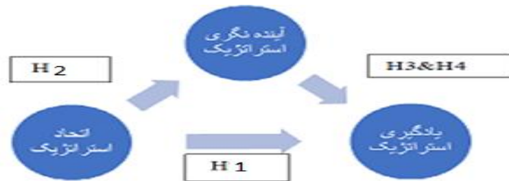
شکل ۱. مدل پیشنهادی پژوهش

مدل پیشنهادی در شکل ۱ نشان داده شده است: