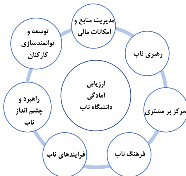
شکل ۱: چارچوب مفهومی پژوهش

همان‌گونه که در جدول و شکل ۱ ملاحظه می‌شود، مؤلفه‌های هفت‌گانه عبارتند از: مدیریت منابع و امکانات، رهبری ناب، تمرکز بر ذی‌نفعان، فرهنگ ناب، فرآیندهای ناب، راهبرد و چشم‌انداز ناب، توسعه و توانمندسازی کارکنان.