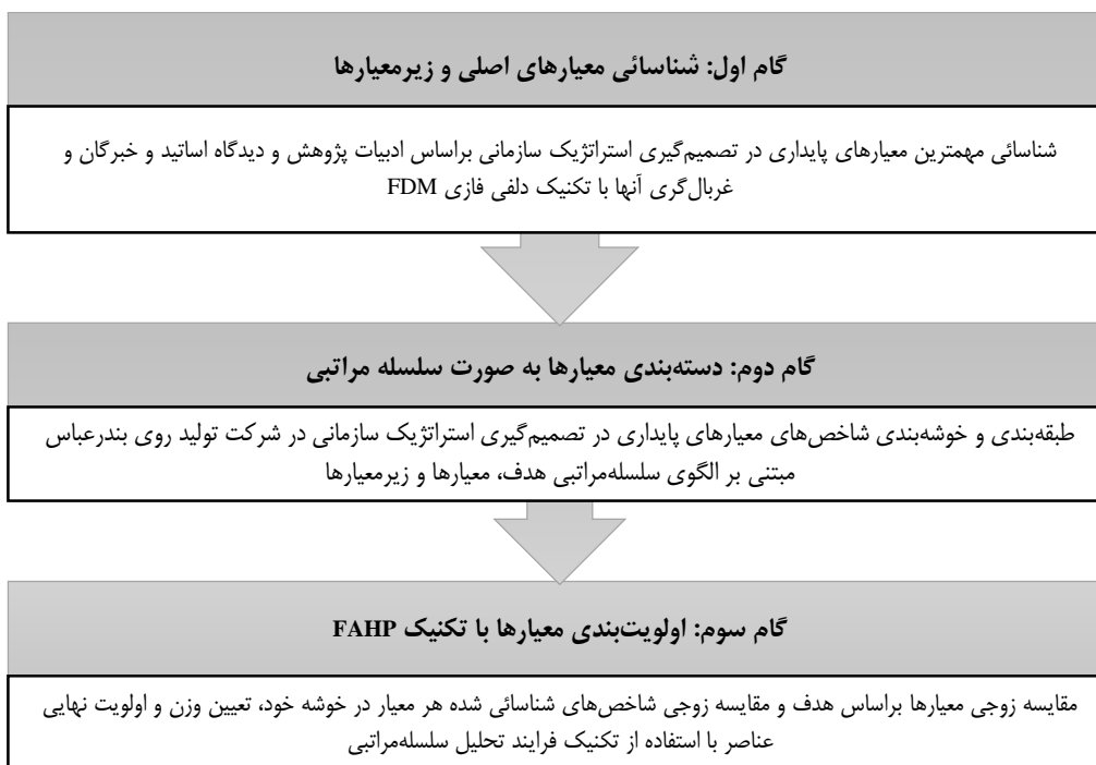
شکل ۲. روش اجرایی پژوهش

سپس میانگین فازی هر یک از معیارها براساس فرمول خاص آن محاسبه و پس از آن فازی‌زدایی با روش مرکز سطح صورت گرفت. در این مرحله، معیارهای فازی‌زدایی شده با مقدار بیش از ۰/۷ مورد تأیید قرار گرفت و برای اولویت‌بندی به مرحله بعدی که تحلیل سلسله‌مراتبی فازی است، وارد شد. در این روش تحلیل، بر مبنای پاسخ‌های مدیران، مقادیر مثلثی فازی به‌جای داده‌های مبهم جایگزین می‌شود. پس از آن ماتریس مقایسات زوجی برای یک سطح سلسله‌مراتب تشکیل می‌گردد. در رویکرد منطق فازی، نقطه تقاطع برای هر مقایسه زوجی پیدا شده و مقدار عضویت آن نقطه با وزن آن برابر می‌گردد. در نهایت، وزن‌های معیارهای پایداری مشخص شده و به‌این ترتیب اولویت‌بندی معیارها صورت می‌گیرد. الگوریتم اجرایی پژوهش در شکل ۲ ارائه شده است.